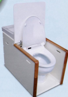
手すりボックス 手洗付